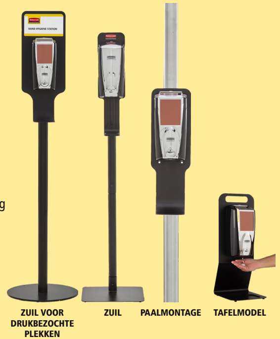
ZUIL VOOR DRUKBEZOCHTE PLEKKEN

Bij een dosis van 0,4 ml haalt u tot 2.750 doses uit een navulverpakking van 1.100 ml